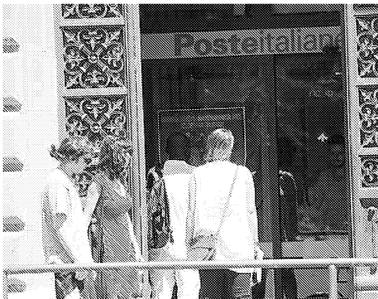
LA SCADENZA ieri mattina in Posta questa era la situazione. Tante le persone che hanno pagato all'ultimo minuto